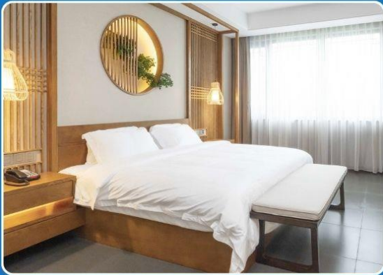
👤👤 DOUBLE (DBL)