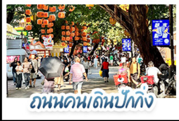
ถนนคนเดินปิกกิ้ง