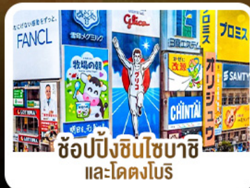
ซื้อปิ้งชินโซบาชิ และโดตงโมริ