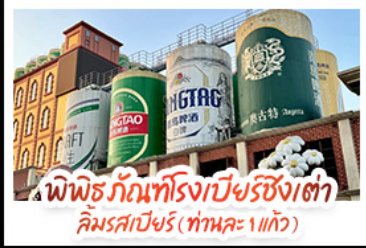
พิพิธภัณฑ์โรงเบียร์ชิงเต่า ลิมรสเบียร์ (ท่าพระ 1 แก้ว)