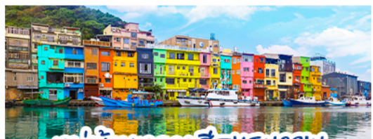
หมู่บ้านหลากสี ZHENGBIN