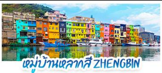
หมู่บ้านหลากสี ZHENGBIN

18 - 21 ก.ค. 69 | 12 - 15 ก.ย. 69 15 - 18 ส.ค. 69 | 28 - 31 ต.ค. 69