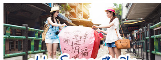
ปล่อยโดมลอยซื้อก๊อฟิน