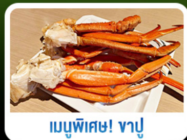
เมนูพิเศษ! ขาปู