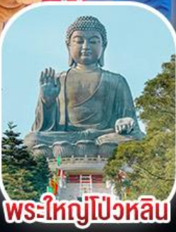
พระใหญ่โป้วหลิน