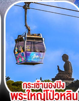
กระเช้าองปิง พระใหญ่ไผ่หวลัน