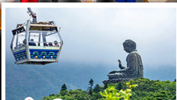
พระใหญ่ไผ่หลินและกระเช้าเองปีง