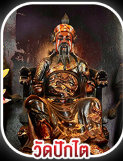
วัดปิกไค