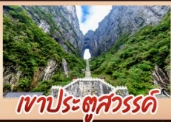
เขาประตูลสวรรค์