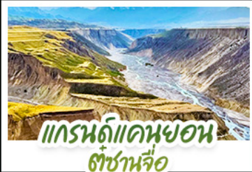
แกรนด์แคนยอน ตู้ซ่านหือ

ปล่อยให้หัวใจล่องลอยไปกับสายลมเย็นบนที่ราบสูง..ในดินแดนที่ความโรแมนติก เบ่งบานท่ามกลางทุ่งหญ้าและหิมะ สัมผัสความพิศวงจึ้งของ "ทุ่งหญ้านาลาติ" และ "ทุ่งหญ้าคาลาจิน" ที่ได้รับการยกย่องว่าเป็นทุ่งหญ้าที่สวยงามที่สุดแห่งหนึ่งของโลก ชมความใสสะอาดของ "ทะเลสาบไซหลี่มู่" น้ำตาศายสวยสุดทึ่งของมหาสมุทรแอตแลนติก ที่สะท้อนเงาภูเขาหิมะอย่างงดงาม