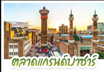
ตลาดแกรนด์ปาร์ซารี