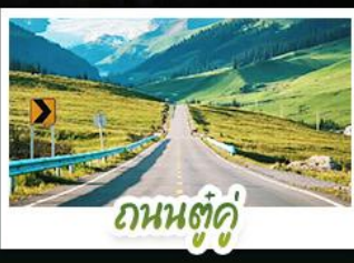
ถนนตู้ตู้