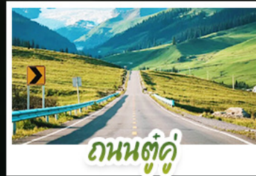
ถนนตู้คู้