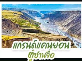
แกรนด์แคนยอน ตู้ซ่านหลือ

ปล่อยให้ตัวเองลอยไปกับสายลมเย็นบนที่ราบสูง...ในดินแดนที่ความโรแมนติก เบ่งบานท่ามกลางทุ่งหญ้าและหิมะ สัมผัสความเขียวจีของ "ทุ่งหญ้านาลาตี" และ "ทุ่งหญ้าคาลาชัน" ที่ได้รับการยกย่องว่าเป็นทุ่งหญ้าที่สวยงามที่สุดแห่งหนึ่งของโลก ชมความใสสะอาดของ "ทะเลสาบโซ่หลี่บู" น้ำตกหายคุดท้ายของมหาสมุทรแอตแลนติก ที่สะท้อนเงาภูเขาหิมะอย่างงดงาม