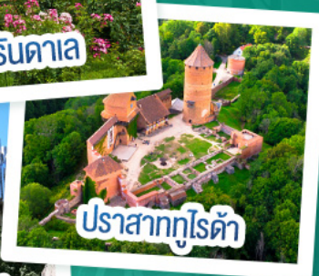
ปราสาทกูไรต้า