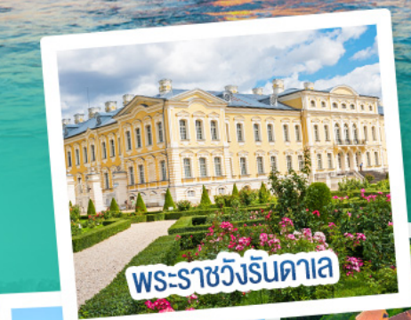
พระราชวังรินดาเล