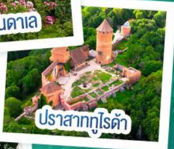
ปราสาททูไรดา