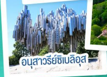
อนุสาวรีย์ซีเบลอุส

ฟินแลนด์ - เอสโตเนีย - ลัตเวีย - ลิทัวเนีย แวะเที่ยวเซี่ยงไฮ้