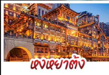
แดงเขยาดัง