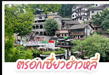
ตรอกเซี่ยวฮ่าวเสี