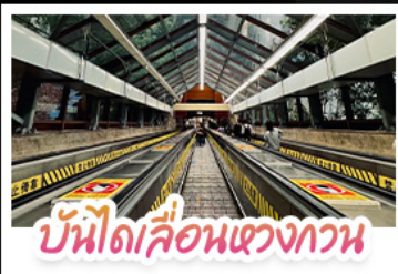
บันไดเลื่อนแขวงทวน