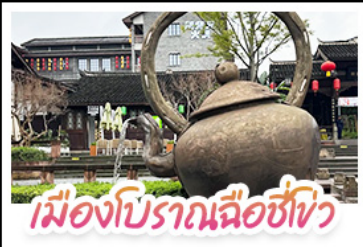
เมืองโบราณฉือชี่เซว