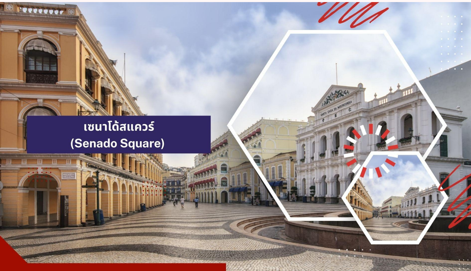
เซนาโด้สแควร์ (Senado Square)

จากนั้นนำท่านชม วิหารเซนต์ปอล โบสถ์แห่งนี้เคยเป็นส่วนหนึ่งของวิทยาลัยเซนต์ปอล ซึ่งก่อตั้งในปี ค.ศ. 1594 และปิดไปในปี ค.ศ. 1762 และเป็นมหาวิทยาลัยตามแบบตะวันตกแห่งแรกของเอเชียตะวันออกเฉียงใต้ โบสถ์เซนต์ปอลสร้างขึ้นในปี ค.ศ. 1580 แต่ถูกทำลายถึงสองครั้ง ในปี ค.ศ. 1595 และ ค.ศ. 1601 ตามลำดับ จนกระทั่งเกิดเพลิงไหม้ในปี ค.ศ. 1835 ทั้งวิทยาลัย และโบสถ์ถูกทำลายจนเหลือแต่ด้านหน้าของตึกฐานโบสถ์ส่วนใหญ่และบันไดด้านหน้าของตึก แสดงให้เห็นถึงสไตล์ผสมระหว่างตะวันออกและตะวันตกและมีอยู่ที่นี่เพียงแห่งเดียวเท่านั้นในโลก