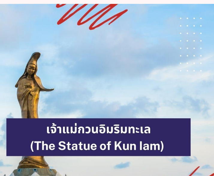
เจ้าแม่กวนอิมริมทะเล (The Statue of Kun lam)