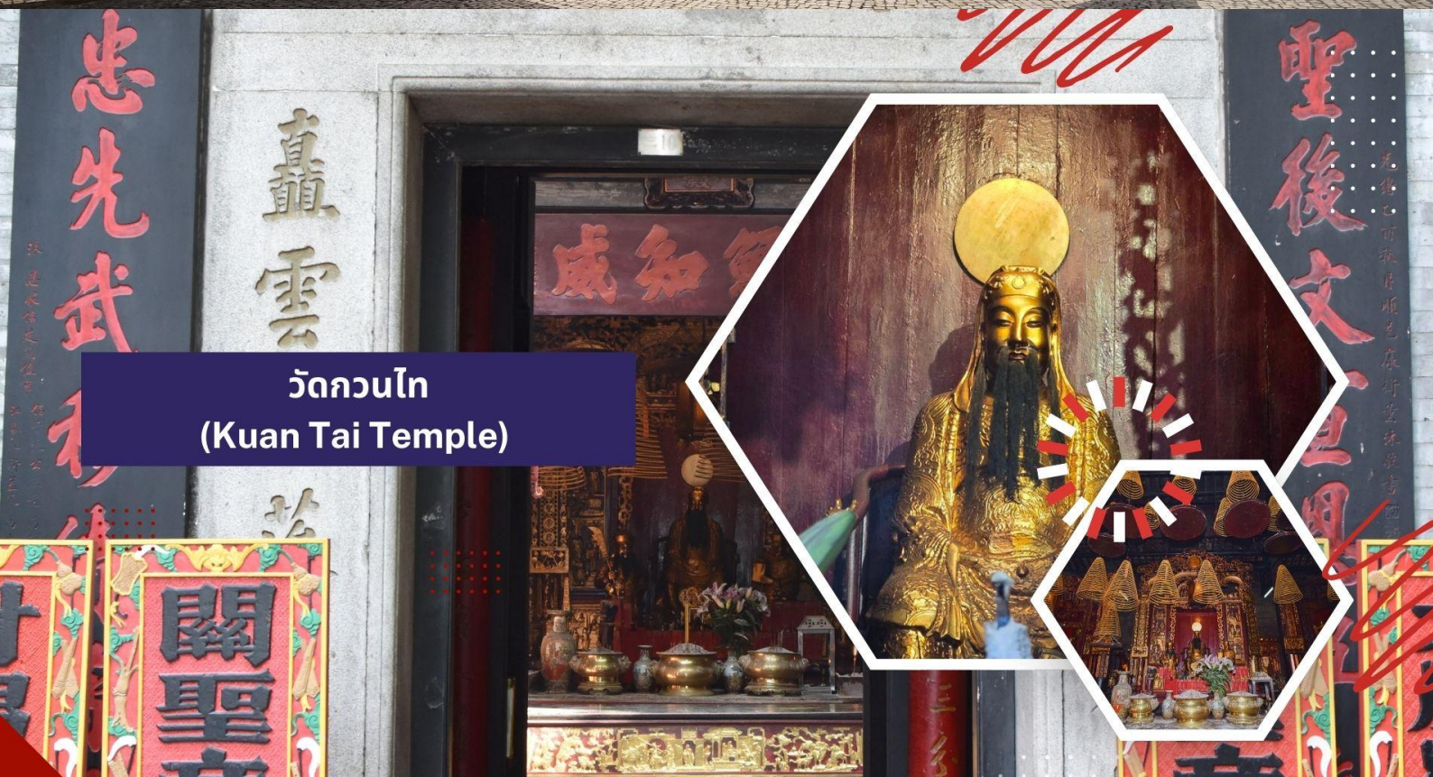
วัดกวนไท (Kuan Tai Temple)