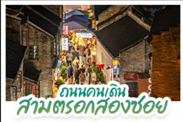
ถนนคนเดิน สามตรอกสองซอย

สัมผัสประสบการณ์ล่องเรือชมน้ำตกเต๋อเทียนแบบใกล้ชิด ชมแสงสียามค่ำคืน ณ เมืองโบราณโก่ผิง • ทำความหนาวเย็น อากาศดีตลอด ณ ถ้ำน้ำแข็งหลงกวง • เช็กอินติดเทรนด์กับท่าเรือ กังจื่อตักสไตล์ยุโรป • ชมหมู่บ้านสไตล์ยุโรป ทะเลสาบหมิงยว ช้อปปิ้งเพลินถนนคนเดิน สามตรอกสองซอย