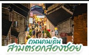
ถนนคนเดิน สามตรอกสองซอย

สัมผัสประสบการณ์ล่องเรือชมน้ำตกต่อเนื่องแบบใกล้ชิด ชมแสงสียามค่ำคืน ณ เมืองโบราณไท่ผิง • ทัศนียภาพอัน อากาศดีตลอด ณ ถ้ำน้ำแข็งหลงกวง • เชื้ออินทรีย์เกรดพรีเมียมกับท่าเรือ ถึงจิ้งจอกสไตลยุโรป • ชมหมู่บ้านสไตลยุโรป ทะเลสาบหมิงเยว่ ช้อปปิ้งเพลินถนนคนเดิน สามตรอกสองซอย