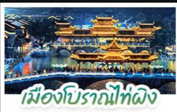
เมืองโบราณไท่ผิง