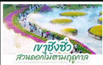
เขาส่งชี้ว สวนดอกไม้ตามฤดูกาล