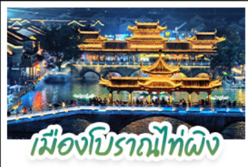
เมืองโบราณโก่ผิง