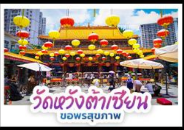
วัดเซ่งต้าเซียง บอพรสุภภาพ