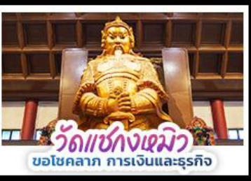
วัดเซ่งกงเซมิว ขอโชคกลาง การเงินและธุรกิจ