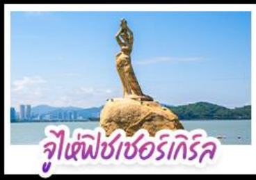
จูเซ็ฟิซเซอร์ทึกรึค