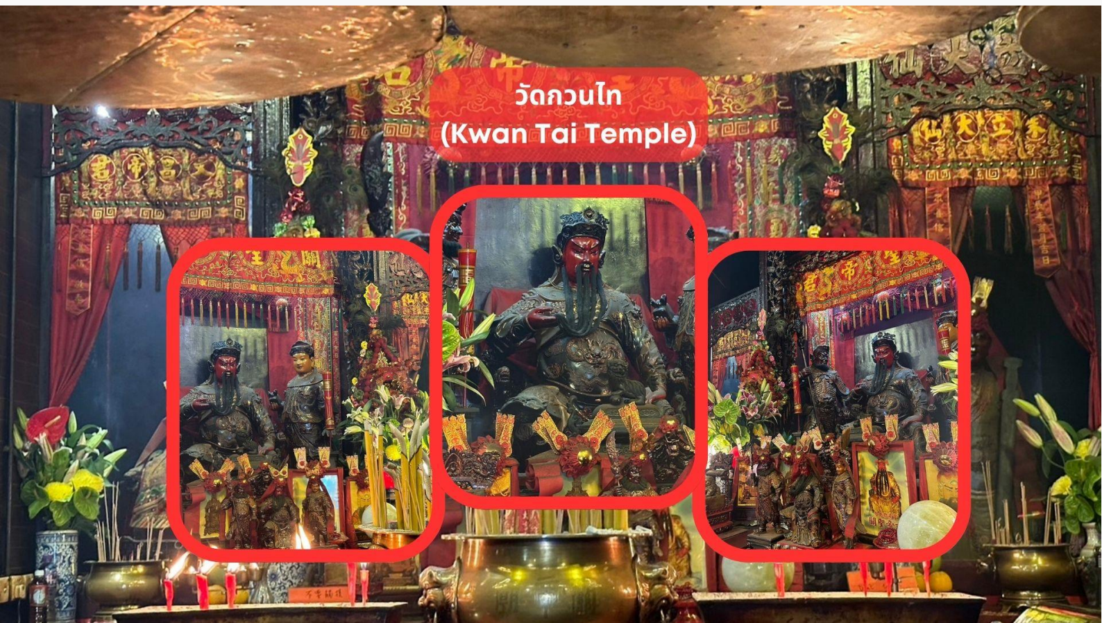
วัดกวนไท (Kwan Tai Temple)

รับประทานอาหารเช้า ณ ภัตตาคาร บริการท่านด้วยเมนูติ่มซำฮ่องกง (มื้อที่ 2)