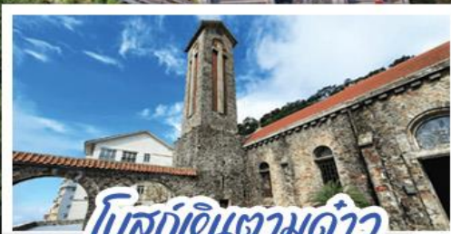
โบสถ์ดินตามด้าว