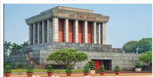
จัตุรัสบาติงห์