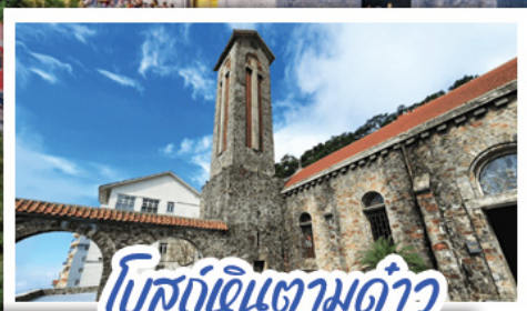
โบสถ์หินตามด้าว