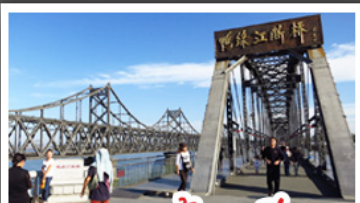
ตามองตัวคนเดียว