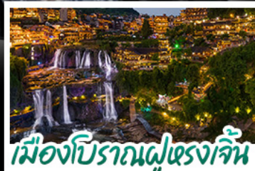
เมืองโบราณฝูหลงเจิน