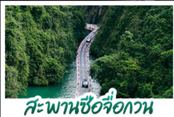
สะพานซื่อจื่อกวน