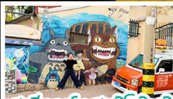
สตรีทอาร์ต สตุตโฮจิบลิ