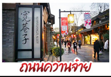
ถนนความจำ