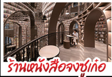
ร้านหนังสือจชู่เก๋อ

อุทยานกุหลาบสี่ฤดู อุทยานนี้ติ่งไท่ หมี่แพนด้านอนเซลพี๋ ร้านหนังสือจชู่เก๋อ วัดต้าฉือ ถนนโบราณความจำ ซ้อปิ้งย่านคัง ถนนไท่กู่หลี่ + ถนนชุนซู่ เมบูพิเศษ สุกั๋หมาล่าเสวอน