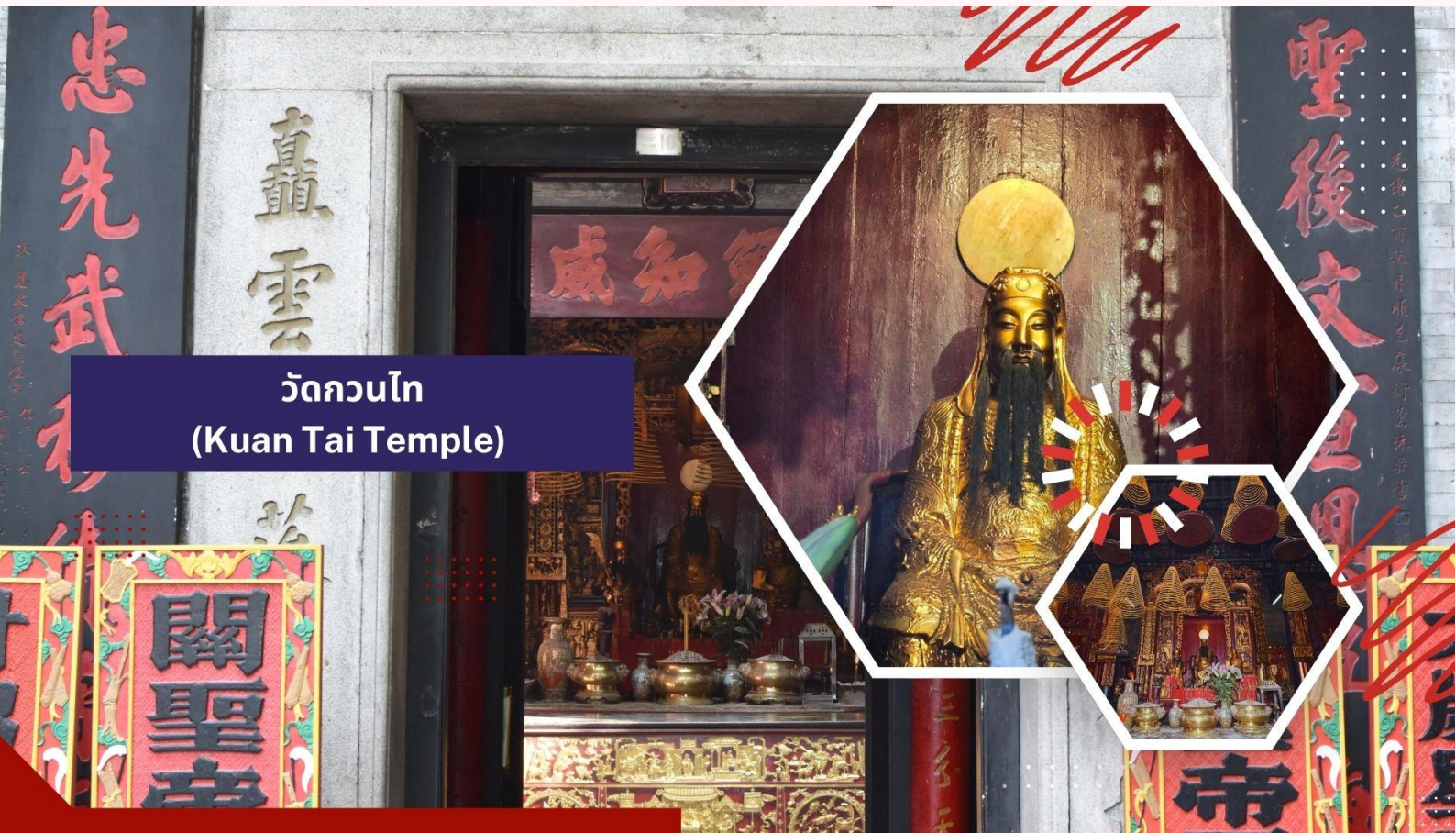
วัดกวนไท (Kuan Tai Temple)

นำท่านเดินทางสู่ วัดกวนไท (Kuan Tai Temple) หรือรู้จักกันในชื่อ วัดซ่าไถกวยคุน (Sam Kai Vui Kun Temple) เป็นวัดที่มีความสำคัญทางประวัติศาสตร์และวัฒนธรรมในมาเก๊า ได้รับการขึ้นทะเบียนเป็นมรดกโลกของ UNESCO ร่วมกับศูนย์กลางประวัติศาสตร์มาเก๊าในปี ค.ศ. 2005 เนื่องจากคุณค่าทางประวัติศาสตร์ สถาปัตยกรรม และวัฒนธรรมที่โดดเด่น ตั้งอยู่ใจกลางจัตุรัสเซนาโด้และรายล้อมไปด้วยอาคารสไตล์ยุโรป วัดนี้สร้างขึ้นเมื่อปี ค.ศ. 1750 และเป็นที่ประดิษฐานของเทพเจ้ากวนอู ซึ่งเป็นเทพเจ้าแห่งความมั่งคั่งและปกป้องคุ้มครอง วัดแห่งนี้มีเป็นที่นิยมของผู้ทำธุรกิจ ตำรวจ และนักการเมือง เพราะเชื่อว่าสามารถปกป้องสิ่งชั่วร้ายต่างๆ และช่วยเสริมอำนาจบาปในการปกครองและคุ้มครองปรีวาร