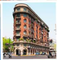
ถนนอุ๊คิง