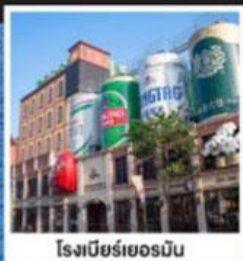
โรงเบียร์เยอรมัน