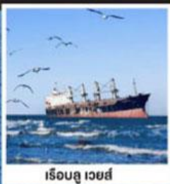
เรือลู เวย์ส