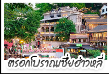
ตรอกโบราณเซี่ยฮ่าวหลี่