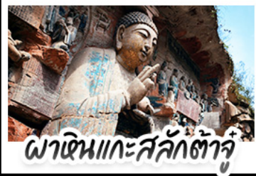
พาเดินแกะสลักต้าจู้