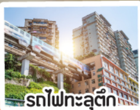
รถไฟฟ้าทะลุติ๊ก