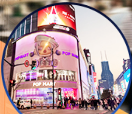
ถนนนานจิง

เที่ยวครบไฮไลท์ ช้อปปิ้งจุใจ อิสระฟรีเดย์ 1 วัน