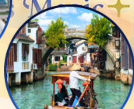
เมืองโบราณจูเจียเจีย