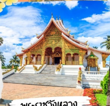
พระราชวังหลวง