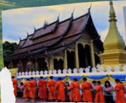
ตักบาตรข้าวเหนียว

การันตีตั๋วเครื่องบินท่านละ 5,000 บาท เดินทางได้ทุกวันยกเว้นวันที่ 25/12 - 5/1 ของทุกปี