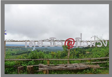
หมอกยามเช้า

เที่ยว ร้านกาแฟ เดอะวิวก๊วม่วง (กาแฟหลักสิบวิวหลักล้าน) คาเฟ่วิวสวย มุมสูงของก๊วม่วง ราคาหลักสิบ วิวหลักล้าน ที่เราจะสามารถมองเห็นดอยภูคาอยู่ด้านหน้า หากไปวันที่อากาศดี ๆ จะได้พบกับเหล่าบรรดาหมอกบริเวณยอดเขา และเป็นอีกหนึ่งจุดชมวิวทะเล