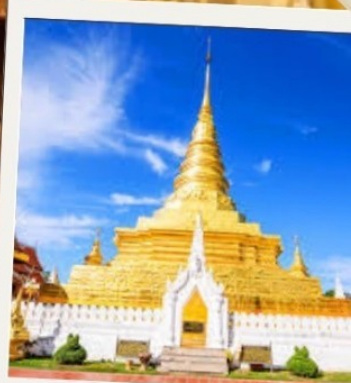
วัดพระธาตุแช่แห้ง

หมายเหตุ: * โปรแกรมอาจมีการเปลี่ยนแปลง สถานที่ โรงแรม ข้อมูลการเดินทาง ราคา* เพื่อความถูกต้องกรุณาตรวจสอบกับพนักงานขายทุกครั้ง