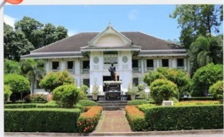
คู่มือเจ้าหลวงเมืองแพร์