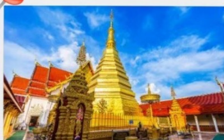
วัดพระธาตุช่อแฮ