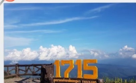
จุดชมวิวที่มีความสูง 1715