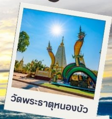
วัดพระธาตุหนองบัว