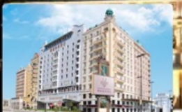
Grand Inn Hotel

กินอิ่ม นอนอุ่น พักหรู อยู่ดี การันตี 4 ดาว