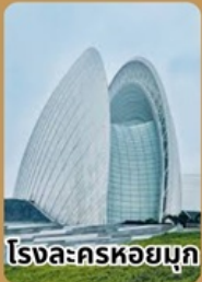
โรงละครหอยมุก