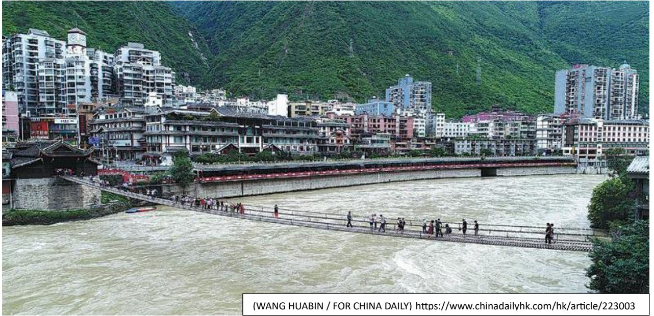
(WANG HUABIN / FOR CHINA DAILY) https://www.chinadailyhk.com/hk/article/223003

แลกเปลี่ยนทางวัฒนธรรมและเศรษฐกิจในเขตเสฉวน-ทิเบต พระราชทานพระบรมราชานุมัติให้สร้างสะพานนี้ขึ้นในปี ค.ศ. 1705 แล้วเสร็จในปี 1706