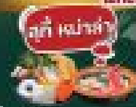
สุกี้ หม่าล่า