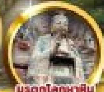
มังกรโลกมหาศิม แกะสลักฉ่าจู้