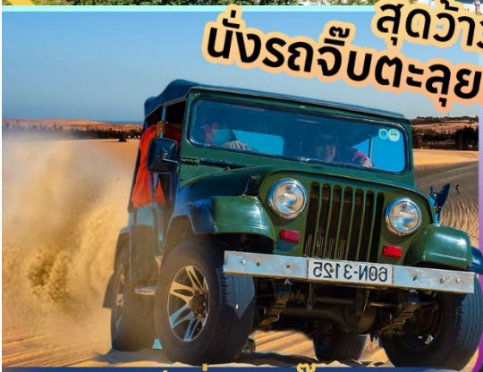
ฟรี! นั่งรถจี๊ป