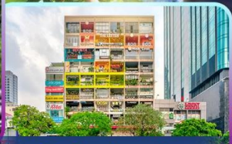
The Cafe Apartment