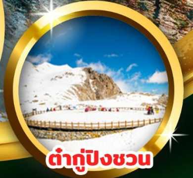
ต่ากู่ปิงชวณ