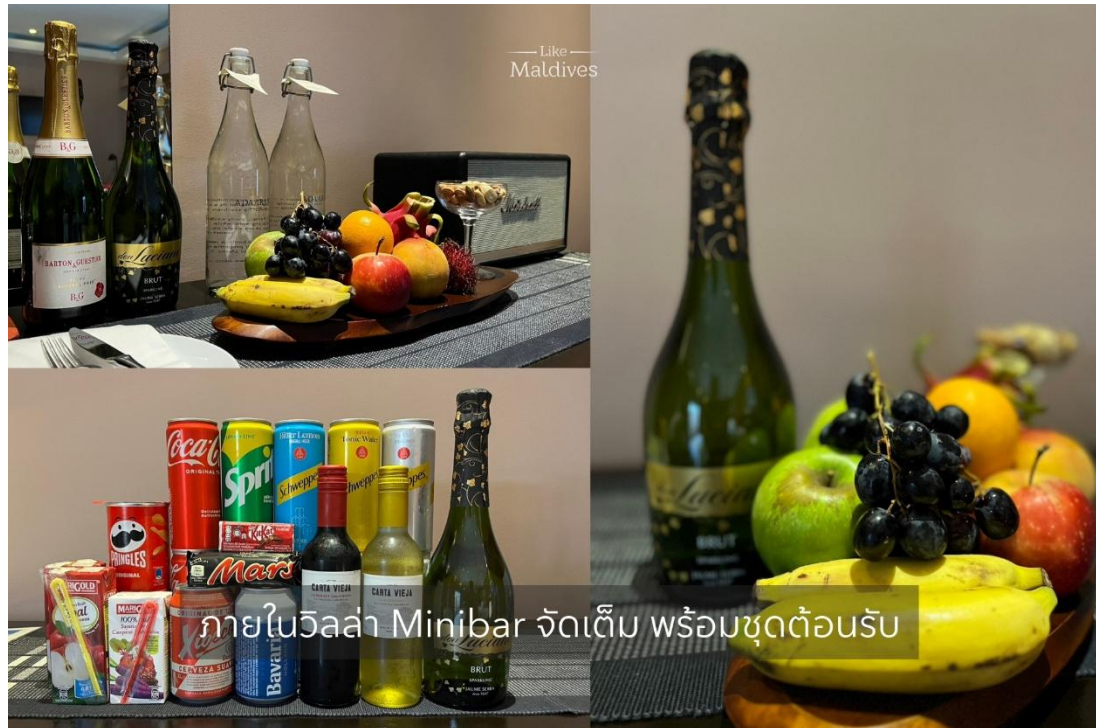
ภายในวิลล่า Minibar จัดเต็ม พร้อมชุดต้อนรับ