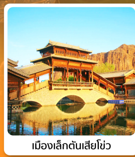
เมืองเล็กตันเสี่ยโซ่ว

อาหารมื้อพิเศษ ไก่นุ่มหม้อไอน้ำ ซีโครงหมูสัโตะลิกันโจว