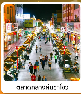
ตลาดกลางคินซาโจว