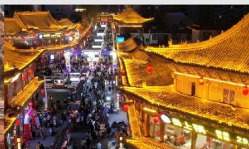
ตลาดกลางคืนจางเย่

*ทางบริษัทฯ ขอสงวนสิทธิ์ในการสลับโปรแกรมทัวร์ตามความเหมาะสมขึ้นอยู่กับสถานการณ์หน้างาน โดยคำนึงถึงผลประโยชน์ของลูกค้าเป็นสำคัญ