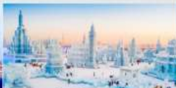
เทศกาลคอมไฟน้ำแข็ง