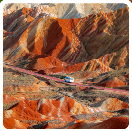
ภูเขาสายรุ้งจากเขี่ย