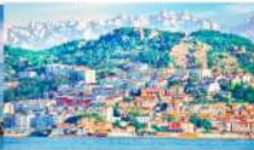
หมู่บ้านชาวประมงซาจื่อโข่ว