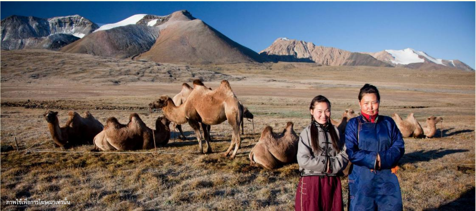
ภาพใช้เพื่อการโฆษณาเท่านั้น

นำท่านร่วมกิจกรรม พิธีต้อนรับแขกสไตล์มองโกล เป็นประเพณีโบราณที่มีมาช้านาน ชาวมองโกลมีอุปนิสัยที่รักเพื่อนฝูงและตรงไปตรงมาไม่เสแสร้ง เมื่อมีเพื่อนหรือแขกมาเยือนก็มักจะผูกมิตรอย่างจริงจัง และนำท่านร่วมกิจกรรม สวมใส่ชุดมองโกล สัมผัสพลังแห่งบรรพบุรุษ สวมเสื้อคลุมแบบดั้งเดิมที่มีสีสันสดใส ปักลวดลายอันประณีต คุณจะสัมผัสได้ถึงพลังแห่งบรรพบุรุษที่เคยปกครองดินแดนครึ่งโลก การสวมหมวกขนสัตว์ ผูกสายรัดเอว พร้อมเครื่องประดับเงินแท้ที่ส่องแสงระยิบระยับ จะทำให้ท่านเสมือนกลายเป็นนักรบแห่งทุ่งหญ้า พร้อมเครื่องประดับเงินแท้ที่ส่องแสงระยิบระยับ ของชนเผ่าที่เคยปกครองดินแดนครึ่งโลก เมื่อคุณยืนท่ามกลางทุ่งหญ้าไร้ขอบเขต