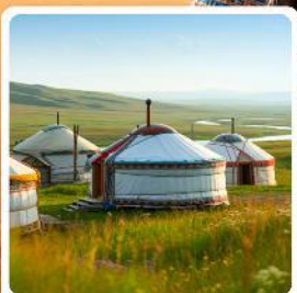
ที่พักแบบกระโจม