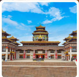
ทำเนียบพระลามะอูหลาน