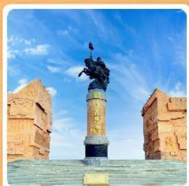
เขตท่องเที่ยวเจงกิสข่าน