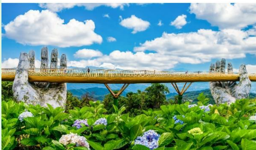
สะพานมือบานาฮิลล์