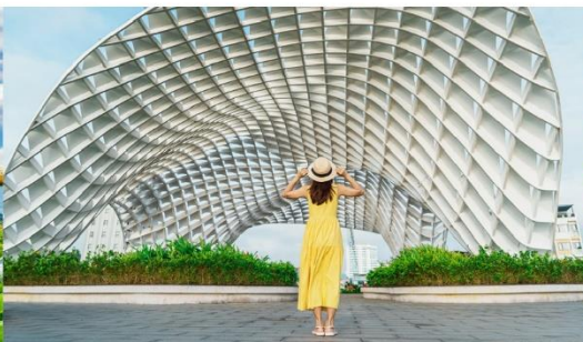
สวนเอเปค