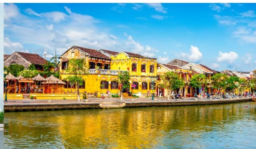
หมู่บ้านฮอยอัน

*กรณีห้องพักบานาฮิลล์เต็ม ขอสงวนสิทธิ์ในการเปลี่ยนวันเข้าพัก และปรับเปลี่ยนโปรแกรมโดยคำนึงถึงผลประโยชน์ลูกค้าเป็นสำคัญ