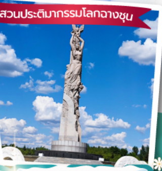
สวนประติมากรรมโลกวางซุน