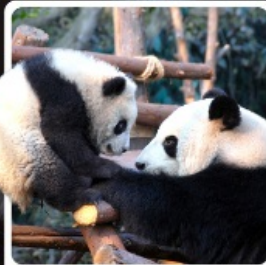
ภูเขาแพนด้าดูเจียงเอี้ยน