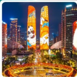
ตึกแฝดเจียงตู