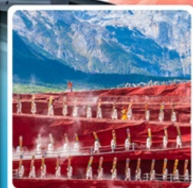
Impressions of Lijiang