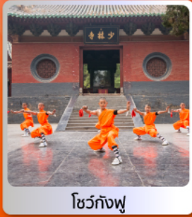
โชว์กังฟู

อาหารมื้อพิเศษ บุฟเฟ่ต์ สุกี่หม้อไฟ เปิดปิกกิ้งซีอาน